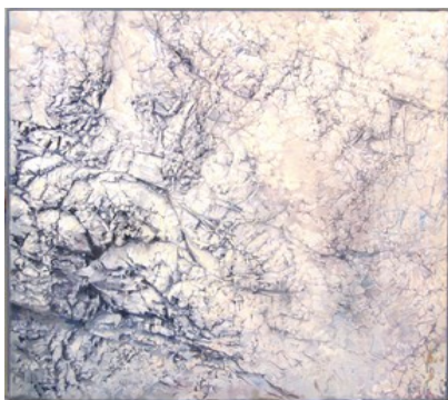
Premi El Piló