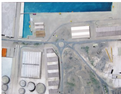
Premi Barat Novella