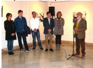
Paraules del President

El dia 30 de Novembre va tindre lloc en la Sala A de la Casa de la Cultura de Burjassot, l'inauguració de l'Exposició de quadros dels autors guanyadors del XXXIV Concurs de Pintura El Piló, realitat l'any passat.