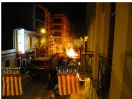
Crema del "monument"

Bé, siga com siga, la qüestió és que aparegueren per la vesprada a l'hora de jugar la partideta i del repartiment del chocolate, que no de fer-lo. Este acte del chocolate té cada dia més adeptes, puix acodixen molts socis i simpatizants en els seus fills o nets, omplint d'alegria el carrer.