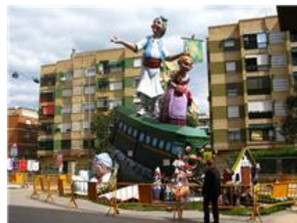
Premi Enginy i Gràcia

Els premis d’Enginy i Gràcia ha segut per a les falles gran i infantil de Nàquera-Lauri Volpi i ha tingut un accésit l’infantil de Fermin Galàn-Primavera.