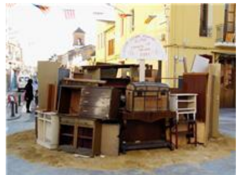
Vista del "monument"

Després d'almorzar vingué la faena d'arreglar els trastos, a vegades entrant a sac en alguna casa que atra i amontonar-los per a fer un monument de coses inútils. I ací es va notar que ad alguns no els havia sentat gens bé l'almorzar perque desaparegueren de l'escena, segurament per a fer la digestió tranquils.