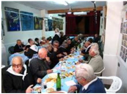
Aspecte de l'almorzar

La Festa de l'Estoreta Velleta és una festa que tots els anys celebra l'Entitat Cultural Valenciana El Piló per a festejar el dia de sant Josep i recordar la costum antiga, de la que naixeren les nostres falles ya fa sigles, quan es confeccionaven a base dels tratos que destorbaven en les cases del veïnat i