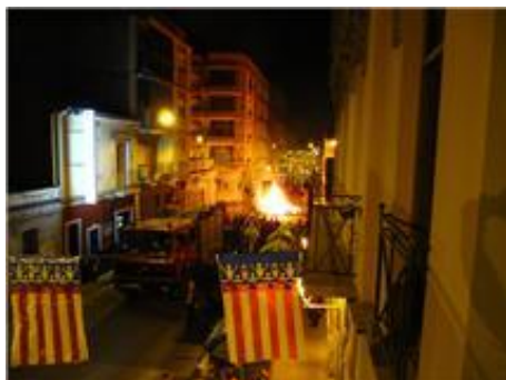
Crema del "monument"

Bé, siga com siga, la qüestió és que aparegueren per la vesprada a l'hora de jugar la partideta i del repartiment del chocolate, que no de fer-lo. Este acte del chocolate té cada dia més adeptes, puix acodixen molts socis i simpatizants en els seus fills o nets, omplint d'alegria el carrer.