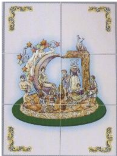
Falla infantil Plaça del Pouet

En Ingeni i Gràcia s'endugueren els premis Cristòfol Sorní-Mestre Ferràn Martín, per la falla gran i Plaça del Pouet per l'Infantil.