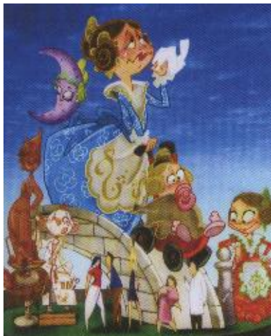
Falla gran Cristòfol Sorní

Com cada any El Piló ha premiat a les falles de Burjassot per la seua activitat durant tot l'any en pro de la difusió de les costums valencianes, de la qualitat dels seus monuments i de la lliteratura dels seus Llibrets.