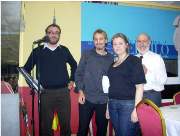
Entrega del Premi Lletraferit

El passat dia 9 de Maig, esta Entitat Cultural Valenciana El Piló, va fer entrega dels premis corresponents al XX Concurs de Narrativa que convoca cada any ab la col·laboració de l'editorial l'Oronella, AELLVA i la Conselleria d'Agricultura de la Generalitat Valenciana.