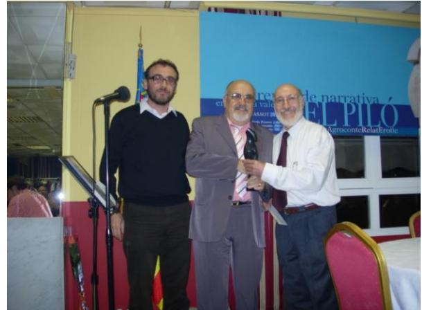
Entrega del Premi de Teatre

Els guardons foren entregats en el tradicional Sopar de Narrativa en el Restaurant Trapemar de Burjassot.