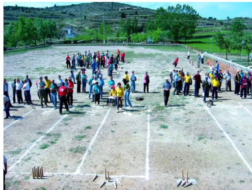
Camp de joc de Pina

Com és costum, pel matí jugarem a les birles, en les onze variants en que es juguen en cada una de les Comunitats i tot seguit dinarem una suculenta paella per a vora quatre cents assistents.