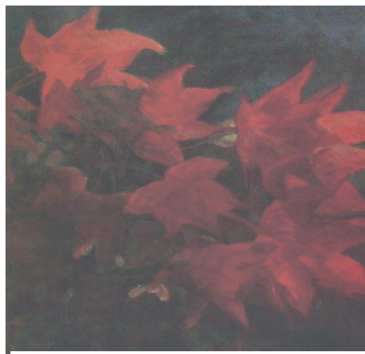
Premi ciutat de Burjassot

1980, es Llicenciada en Belles Arts per l'Universitat Politècnica de Valencia i titulada especialista en Projectes de Pintura "Intensificació en Materies, Tècniques i Poètiques pictòriques"